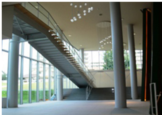
きはだホール入口