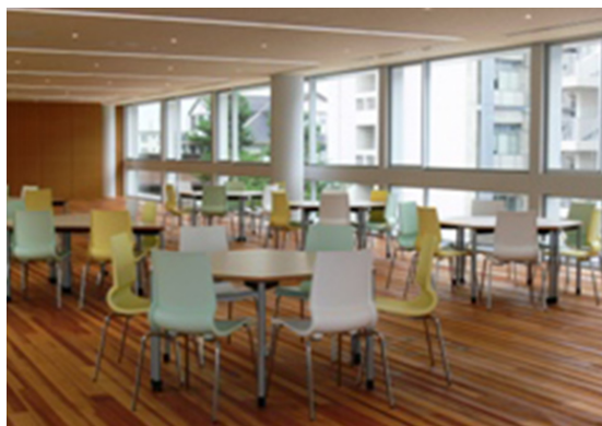
ハイブリッドスペース