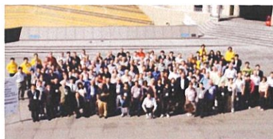
The 65th Yamada Conference The 31st International Conference on the Applications of the Mossbauer Effect ICAME 2017 23-30 September, Kyoto, Japan